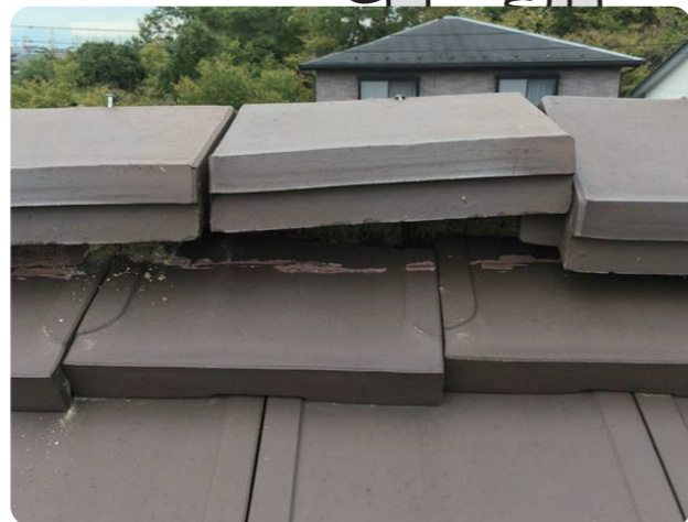
▲屋根の棟部分の瓦が浮いていました

お客様には写真をお見せしながら状態をしっかりと説明し、ご納得いただいた上、修理工事をいたしました。