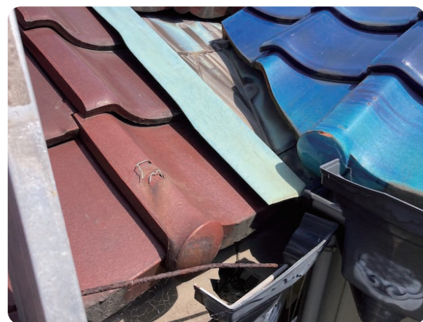
▲実際に雨樋から雨漏りが生じている画像。 ひと目見ただけでは、何が原因かわかりませんが...